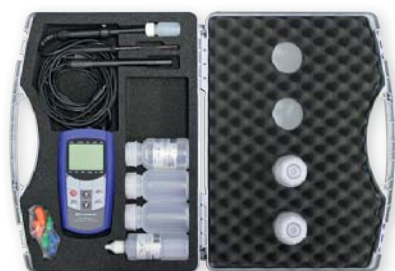
vložka GKK 5001

kufr pro řadu GMH 3000 a GMH 5000 s vyliisovanou vložkou pro 2 přístroje GMH 3xxx nebo GMH 5xxx a příslušenství 5000, 395 x 295 x 106 mm (š x v x h)